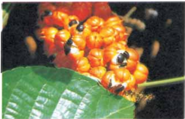
FIG. 3. Frutos completamente maduros, alguns já abertos, no ponto de colheita.