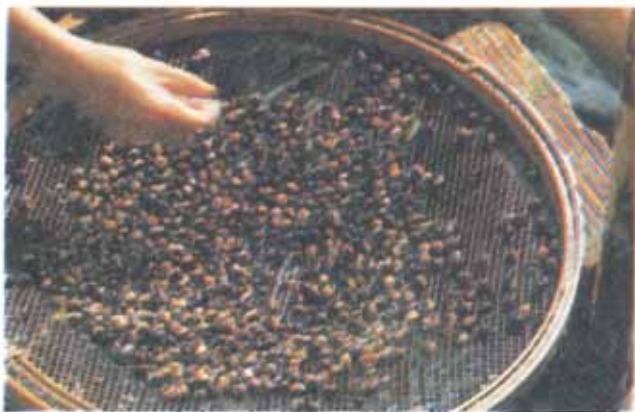
FIG. 4. Lavagem de grãos de guaraná para retirada do arilo.

o despulpamento e a lavagem (Fig. 4). Após a lavagem, as sementes podem ser secas em diversos tipos de secadores.