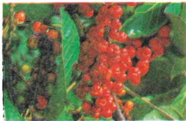
FIG. 2. Frutos maduros de guaranazeiro, que não estão, ainda, no ponto de colheita.