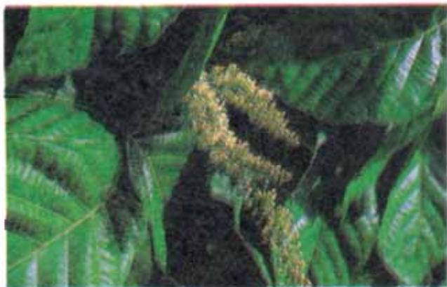
FIG. 1. Floração do guaranazeiro.