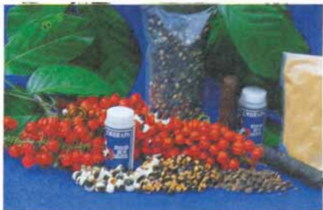
FIG. 6. Cacho maduro, grãos com arilo, grãos lavados, grãos torrados e guaraná em pó.