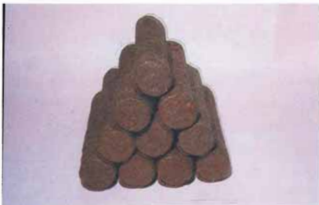
FIG. 5. Guaraná em bastão.